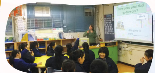
Miss George teaches students about transport