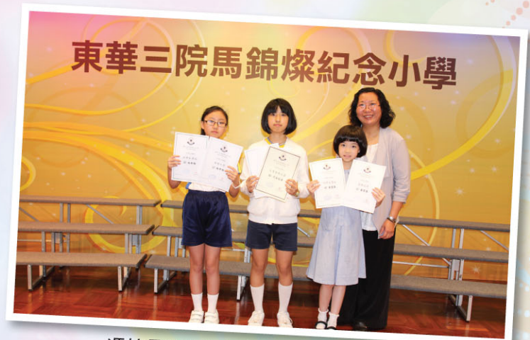
馮校長與高年級「至尊榮譽大獎」及「榮譽大獎」得獎者合照