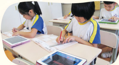
學生上課專注投入