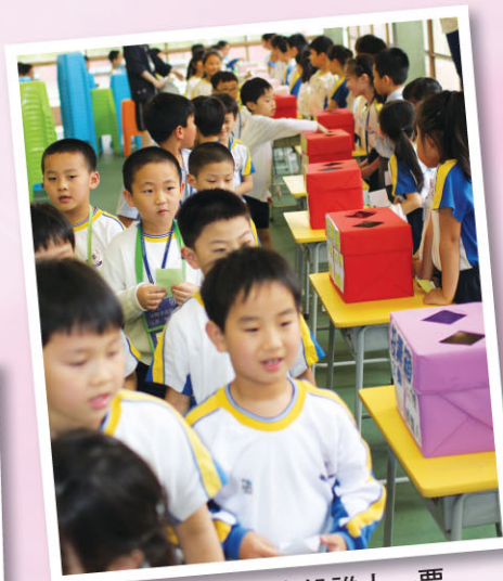
同學正考慮投誰人一票