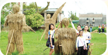
開平風光怡人，不愧擁有「世界遺產」的美譽。