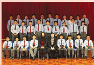
五年級中詩集誦隊