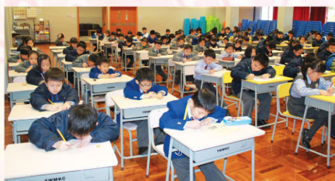
同學們專注地進行作文比賽，多投入啊！