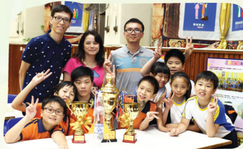
在此順道恭喜東華三院高可寧小學獲大會冠軍。