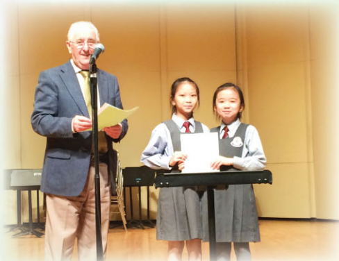
首次參賽，榮獲季軍，欣喜萬分！

本校節奏樂隊於2012年才成立，隊員主要來自一至三年級學生，共有28人。隊員年紀輕輕，基於缺乏練習場地，很多時他們都是在狹窄的走廊練習，環境不算舒適，但憑著他們對音樂的熱誠和隊員之間的合作性，首次參與校際音樂節比賽，已勇奪季軍，實在不易！