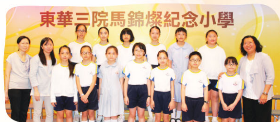
獲亞軍及季軍的同學來個大合照