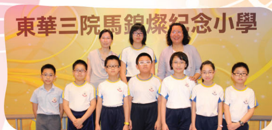
9人組首次合作參加木笛小組比賽，成功獲取季軍成績