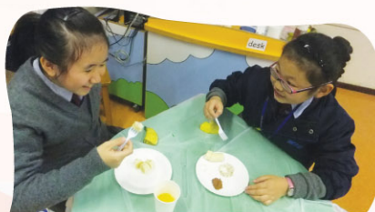
P.4 girls enjoy their crunchy bananas. YUMMY!!