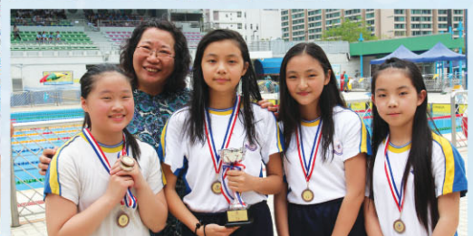
女子甲組奪得4x50米自由泳季軍