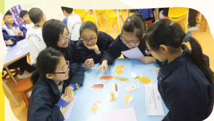
The students like playing games in lunch recess