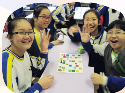
English Ambassadors play board games in the Wednesday Interest Group