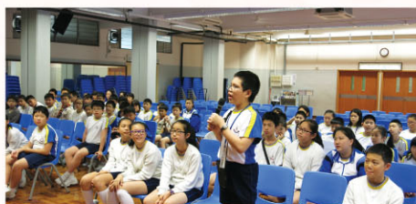
台下同學都表現投入，很支持發言者呢！