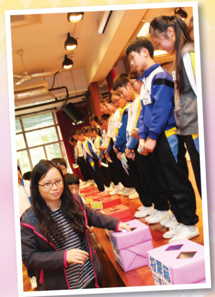
梁老師投票一刻，得票的候選人笑嘻嘻。