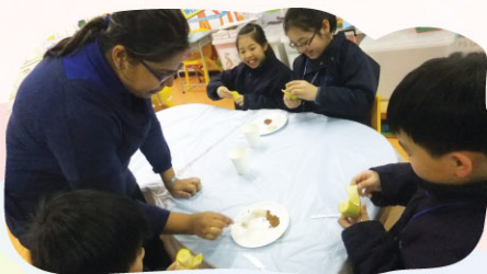
Miss M shows a P.4 student how to make crunchy bananas

We had a lot of exciting events in Term 2.