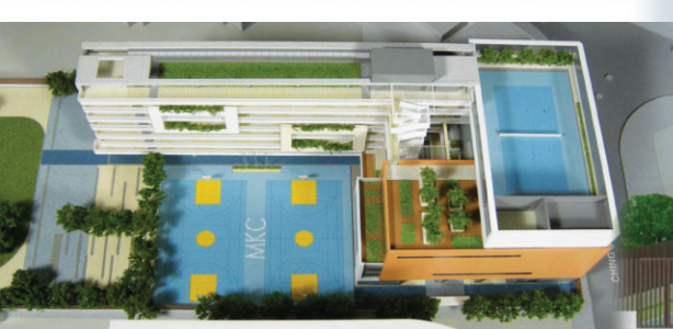
從上下望的校園全貌