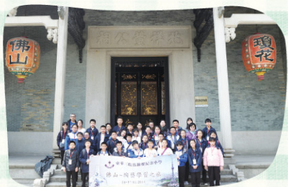
先到廣東粵劇館參觀。

本校在本年1月16日及17日到佛山交流。是次交流有三個重點，分別是欣賞粵劇文化、學習陶藝及欣賞民間工藝品。