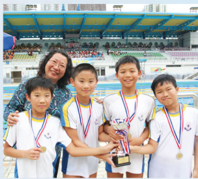
男子甲組勇奪4x50米自由泳亞軍