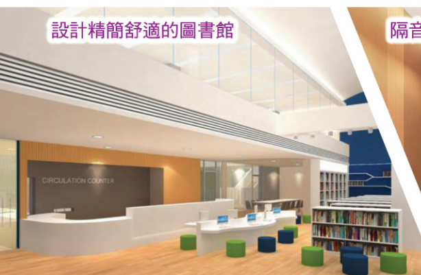
設計精簡舒適的圖書館