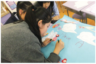
P.6 students make spring murals

Our Elite teams made decorations for the lobby. There was also an Easter party with an egg hunt and other challenging games.