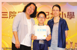
恭喜中詩集誦隊獲季軍