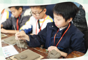
5C區雨奇同學做的是多啦……嗎？