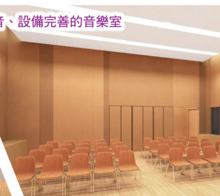
隔音、設備完善的音樂室