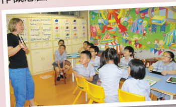
Miss George以iPad輔助說英文故事