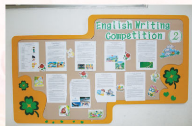
英文作文比賽得獎作品的展示