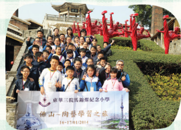
到訪南風古灶，學習製作陶藝。