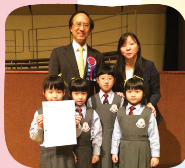
合唱團獲亞軍，跟評判來一張合照吧！