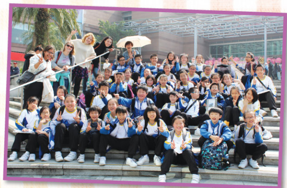
Excursions to The Peak and The Zoo