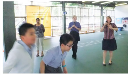
NETS have an Easter party with their after school elite teams