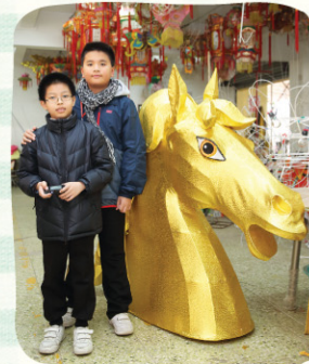
金馬花燈帶來好運氣。