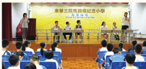
台上同學敢於表達自己的觀點，準備充足呢！

為了讓學生多分析時事新聞及培養他們的批判性思維和表達能力，我們共舉辦了三次的小型辯論活動，名為「敢撐論壇」，分別讓四至六年級的學生以「香港政府應否限制自由行遊客的數目」為題，進行辯論，台下的學生也有發言的機會，場面熱鬧，而同學所發表的內容既充實又切題，表現真不錯呢！