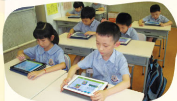
iPad英文電子書有聲有畫