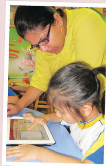
Miss M跟小一同學一起完成iPad練習