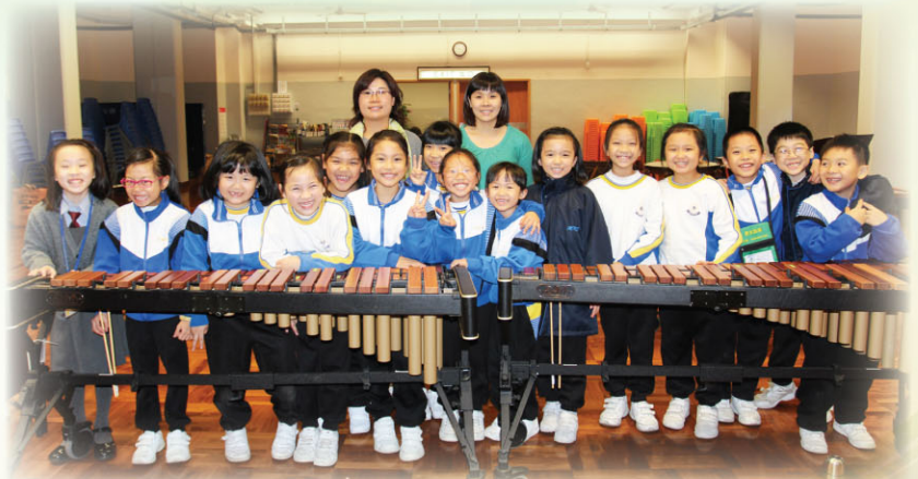
一致的笑臉反映著他們的熱誠和隊員之間的默契。