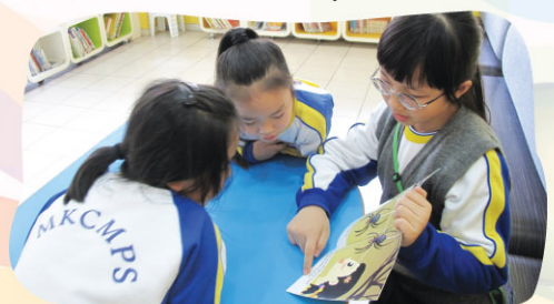
A big buddy reads with two little buddies