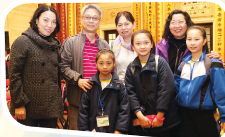
文物館檔案主任史小姐與承傳人合照於東華三院禮堂。