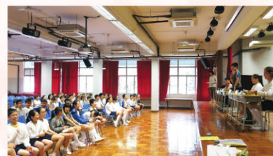
「敢撐論壇」，台下同學都來「撐」一番！