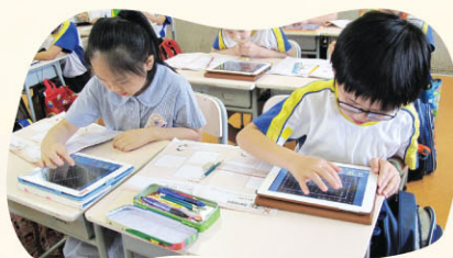
利用iPad工具學習數學