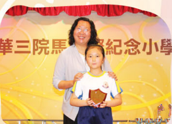
合唱團獲東華三院最佳合唱成績獎，由3D歐曦同代表領獎