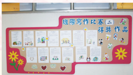
中文作文比賽得獎作品的展示