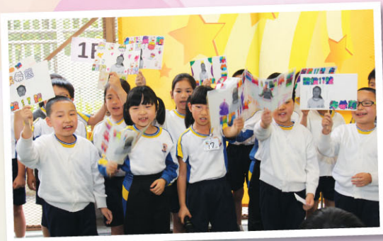
低年級助選團盡力地打氣