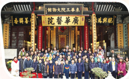
來自13間東華小學的52位文化承傳人攝於東華三院文物館。