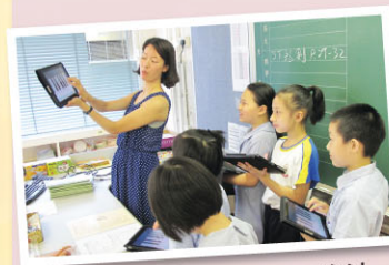
許老師利用iPad教彈琴指法

除iPad班外，其他學生亦有機會於不同課堂中使用iPad輔助學習，以提升學習效能。