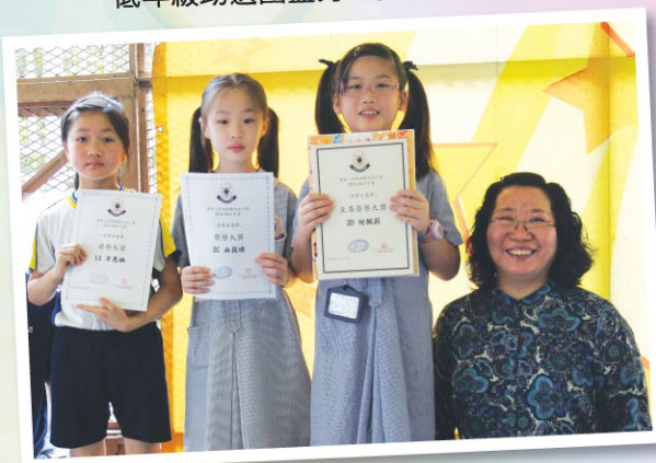
馮校長與低年級「至尊榮譽大獎」及「榮譽大獎」得獎者合照