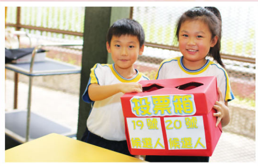
請大家投低年級一票！