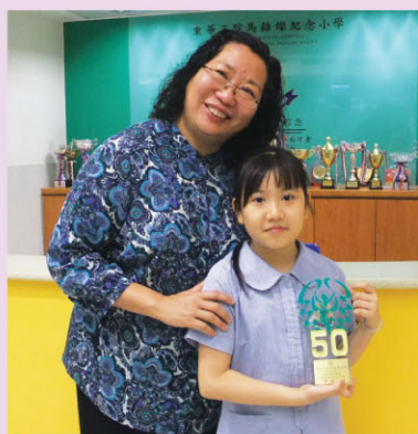
6B 陳咏妃同學獲獎後與校長合照