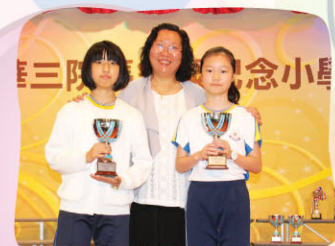
東華三院最佳個人樂器成績獎