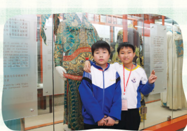
館內四處擺設了極具價值的粵劇展品。