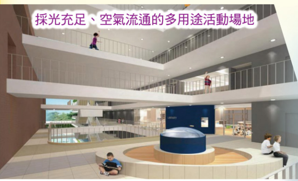
採光充足、空氣流通的多用途活動場地

在硬件上，寬敞的學習空間、設備先進的教學設備、具持續發展的校園規劃……讓我們對學校的未來發展充滿希望；我們將會把持辦學理想，作最好的裝備，以迎接學校發展的新一頁。