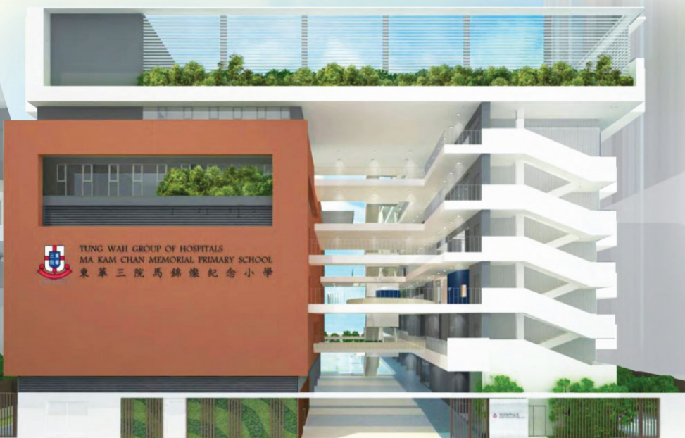
面向清城路的學校外觀