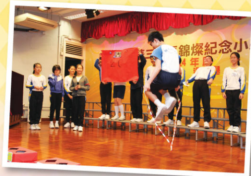
助選團出動「跳繩男」，Oh Yeap!