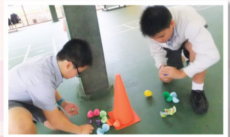
The students are excited to find sweets in their Easter eggs! Wow, how lucky!