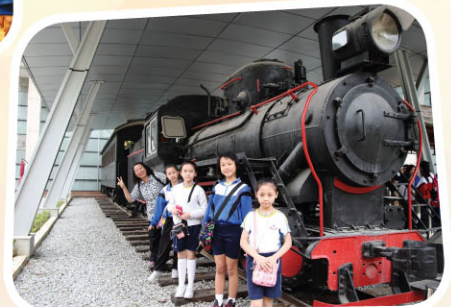
馮校長與承傳人合攝於當地的華僑博物館。