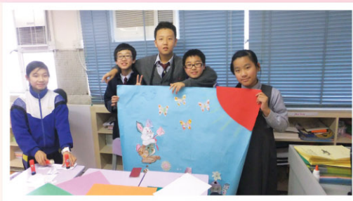
P.6 students show their spring murals