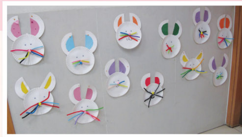
The Easter bunnies look great outside the NET room