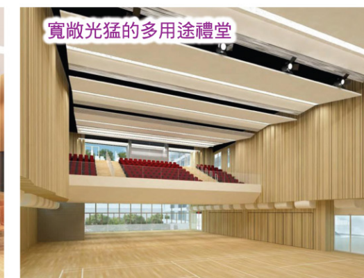
寬敞光猛的多用途禮堂