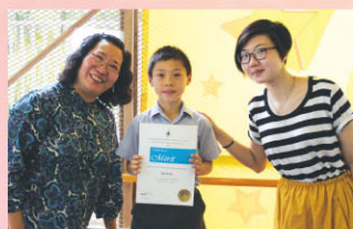
恭喜英詩集誦隊獲亞軍